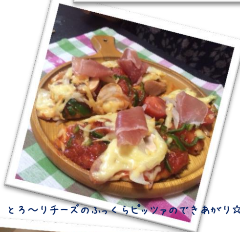
とろ〜りチーズのふくらみピッツァのできあがり☆