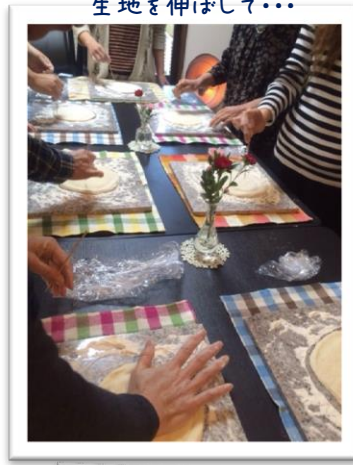
生地を伸ばして・・・