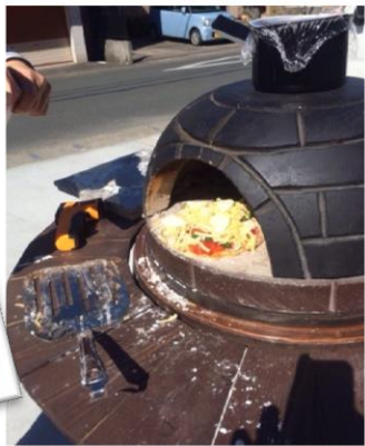
携帯石釜に入れ待つこと8分・・・