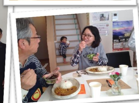
美味しいカレーに自然と笑顔が溢れます♪