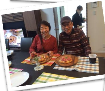
素敵な笑顔と楽しい会話が弾みます♪