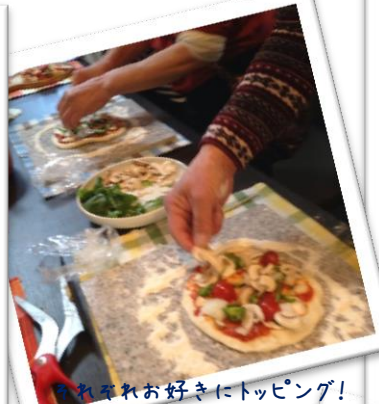
それぞれお好みにトッピング!