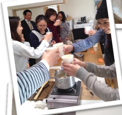
できたマチャイでかんぱ〜い!